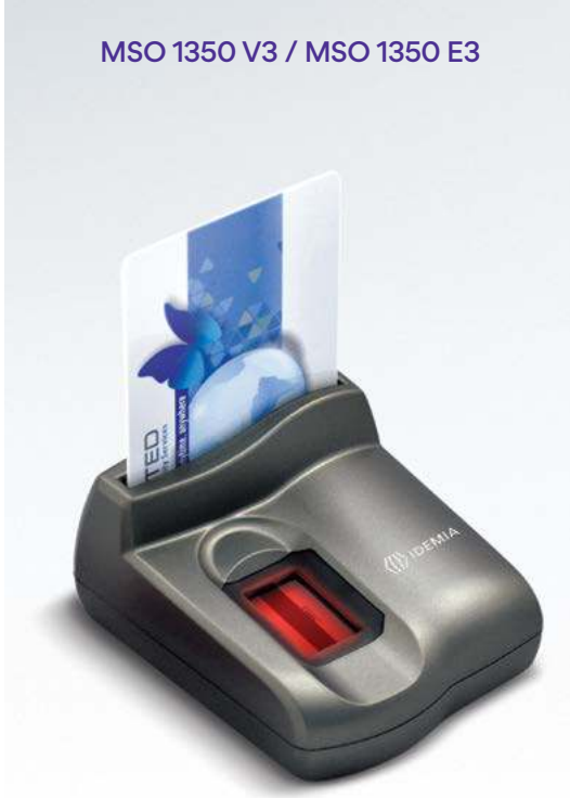
MSO 1350 V3 / MSO 1350 E3