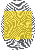
أكثر المناطق الغنية بالبصمة