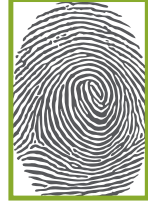
مجال التقاط جهاز MSO 1300 Series للبصمة